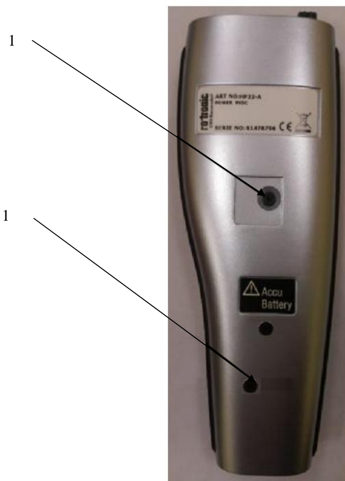
Рисунок 1 - Общий вид комплекса поверочного портативного КПП-3