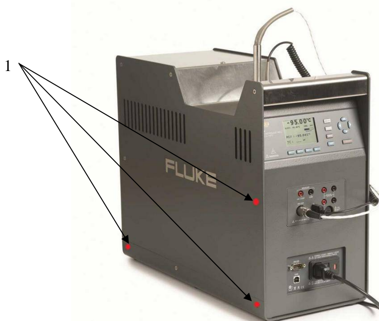
Рисунок 2 - схема пломбирования Комплексов поверочных портативных КПП-2 1 - пломбы на корпусе калибратора температуры сухоблочного Fluke модели 9190A исполнение «-Р».