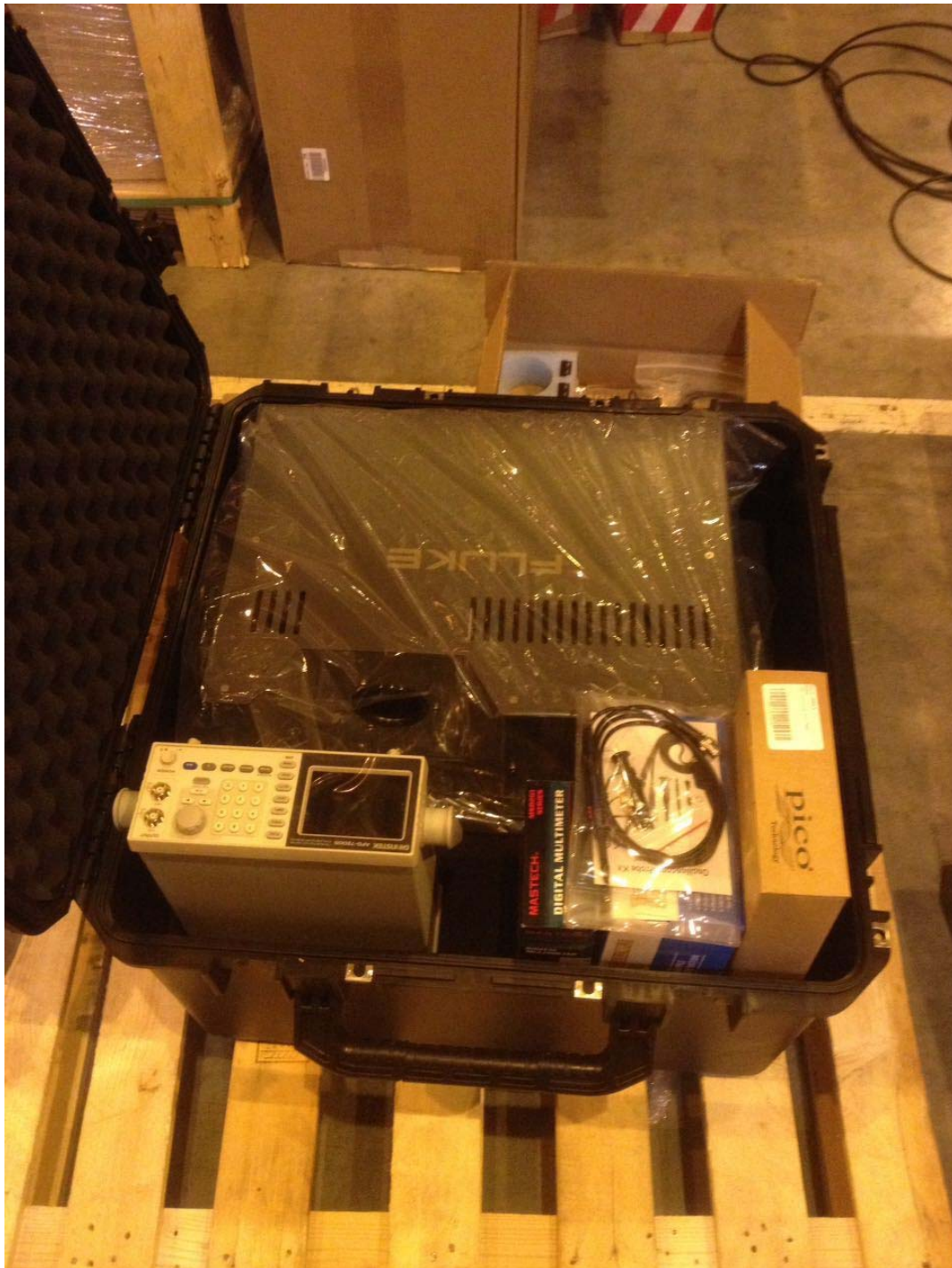
Рисунок 1 - Внешний вид КПП-2

При помощи КПП-2 могут быть поверены следующие датчики температуры воздуха: