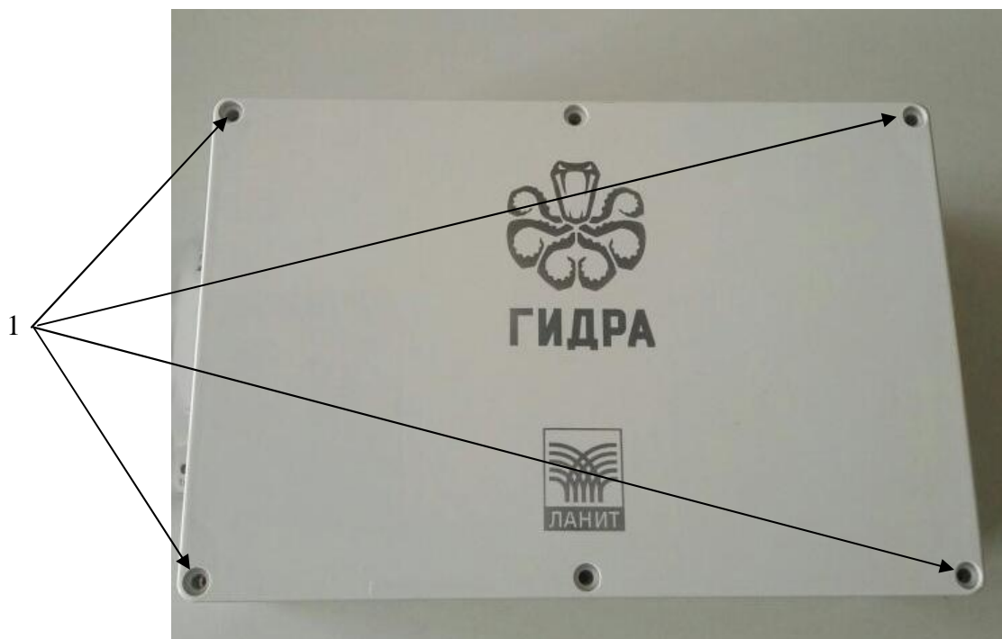
Рисунок 2 – Схема пломбирования комплексов для измерения температуры почвы по глубинам «Гидра».